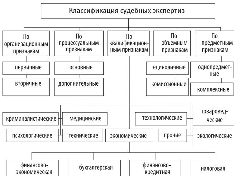
Рис. 1. Схема классификации судебных экспертиз

теоретических работах, так и в отдельных случаях практической деятельности при назначении экспертизы по вопросам экономического характера рекомендуется назначение судебной экономической или судебной финансово-экономической экспертизы без конкретизации ее на роды по сферам исследования экономических наук и использованию разных экономических специальностей.