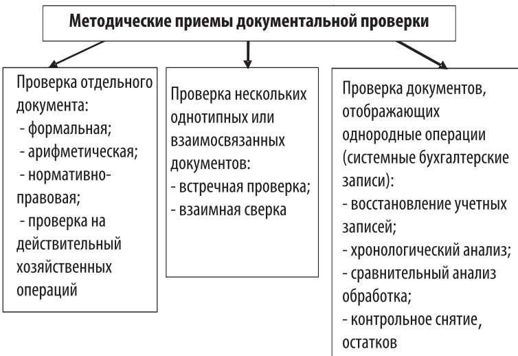
Рис. 4. Классификация методических приемов документальной проверки

Каждый из поименованных выше элементов метода контроля, а тем более их взаимодополняемые комбинации и сочетания, весьма целесообразны и успешно используются в различных хозяйственных системах. В ряде случаев приведенный выше перечень этих элементов носит условно классификационный характер.